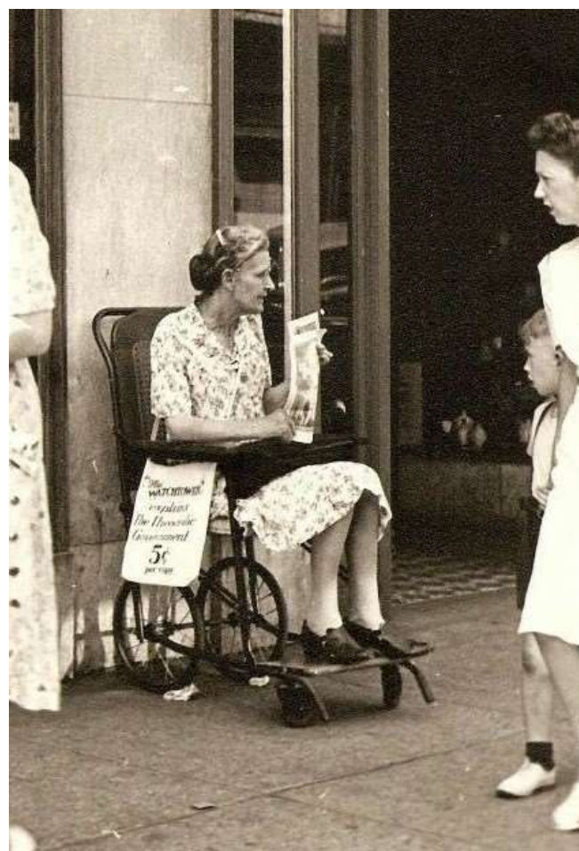
Проповедь с журналами, 1940-ые годы