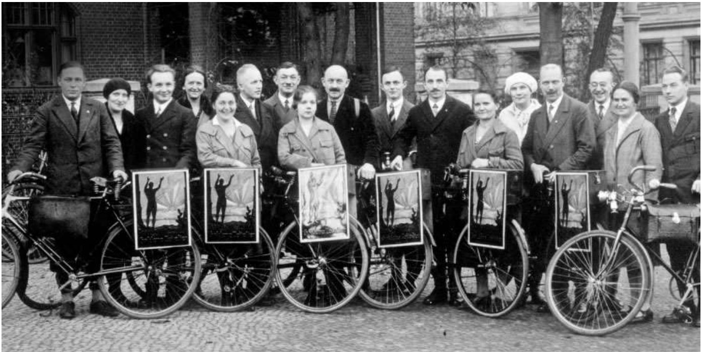
Проповедническая деятельность в Германии, 1930-ые годы

снимки наглядно отражают, каким было понимание вопроса о покрытии головы среди Свидетелей Иеговы в разных странах в тот период.