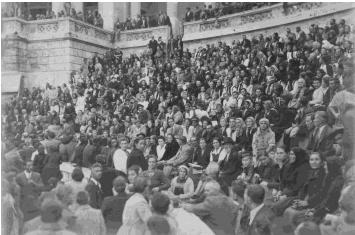
Конвенция в Румынии, Бухарест, 1946г.