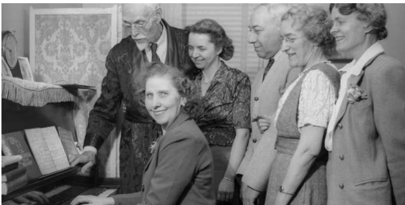
Пение песен, 1940-ые года