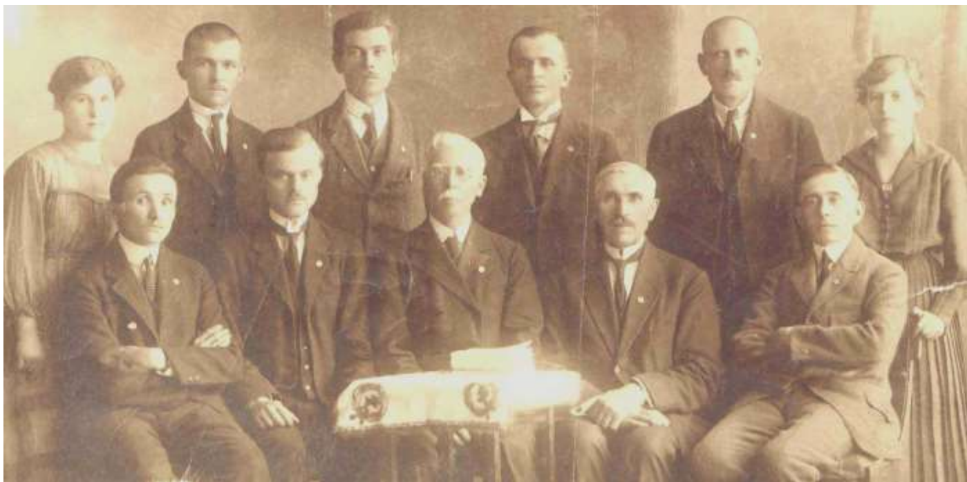
Пионеры в Румынии, 1920-ые годы.

Но какие перемены произошли между народом Иеговы в 1926 году? В книге «Свет» 1930г., Том 1, ст. 215, 216, англ. изд. читаем: