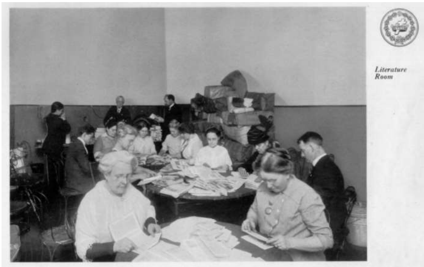
Литературная комната, 1914г.