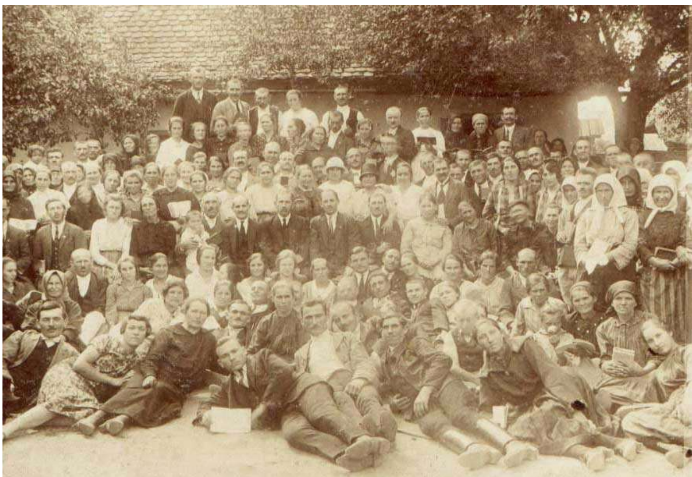
Конвенция в Румынии, Велурень, 1926г.