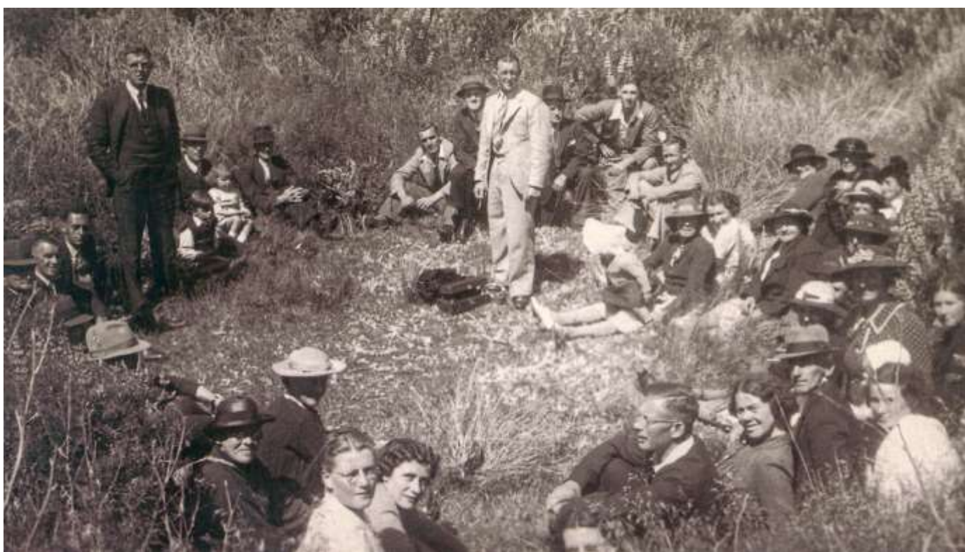
Подпольное собрание после запрета организации в Новой Зеландии, 1940-ые годы