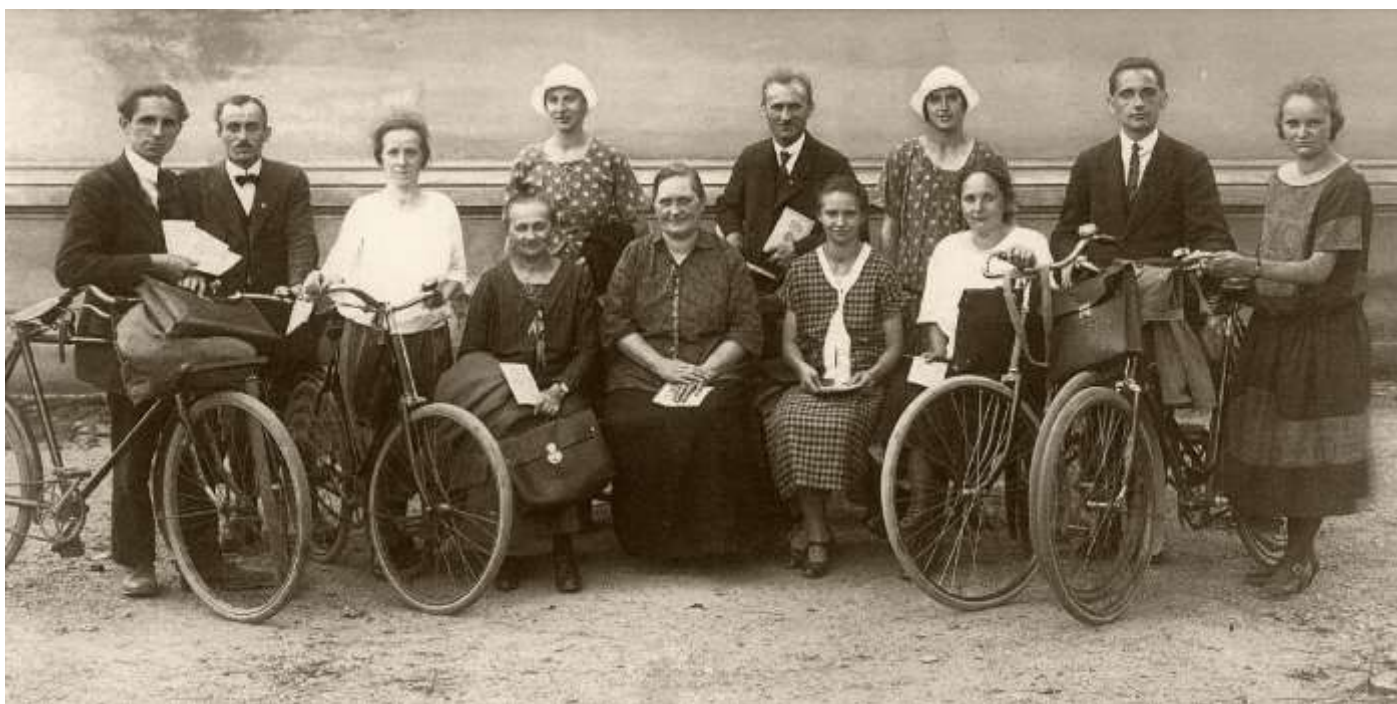
Миссионерская деятельность в Германии, 1920-ые годы