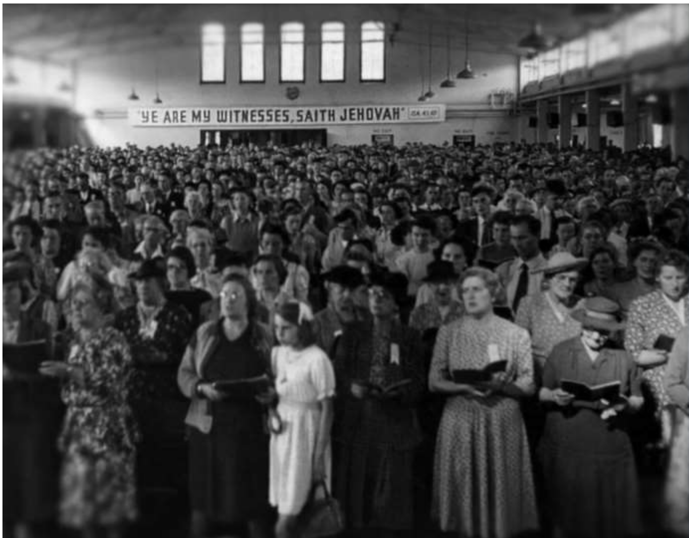
Совместное песнопение на конвенции 1930-40-ые годы