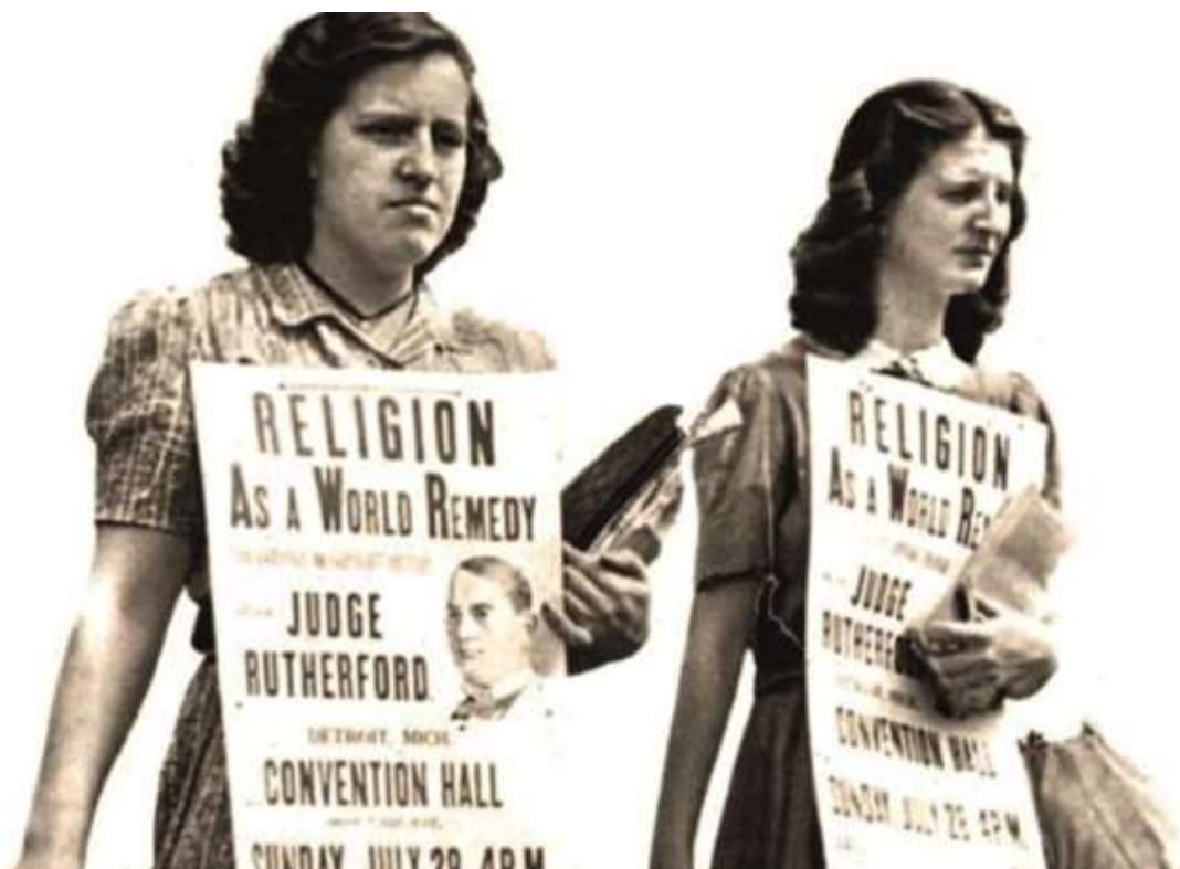
Проповедь с транспарантами, 1930-ые годы