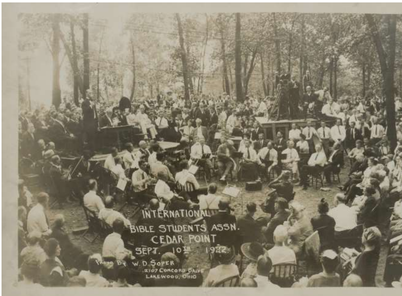
Конвенция Исследователей Библии в США, 1922г.