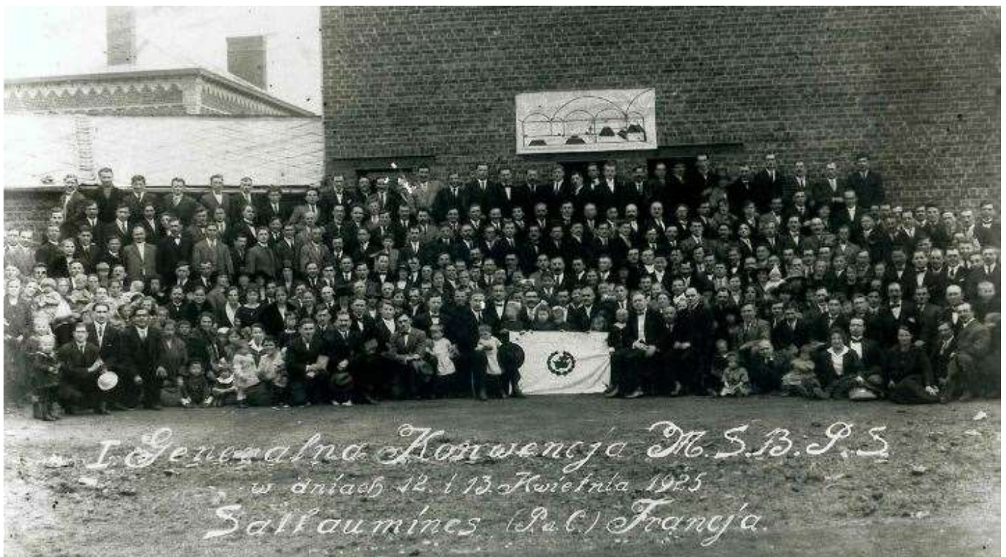
Конвенция Исследователей Библии во Франции, 1925г.