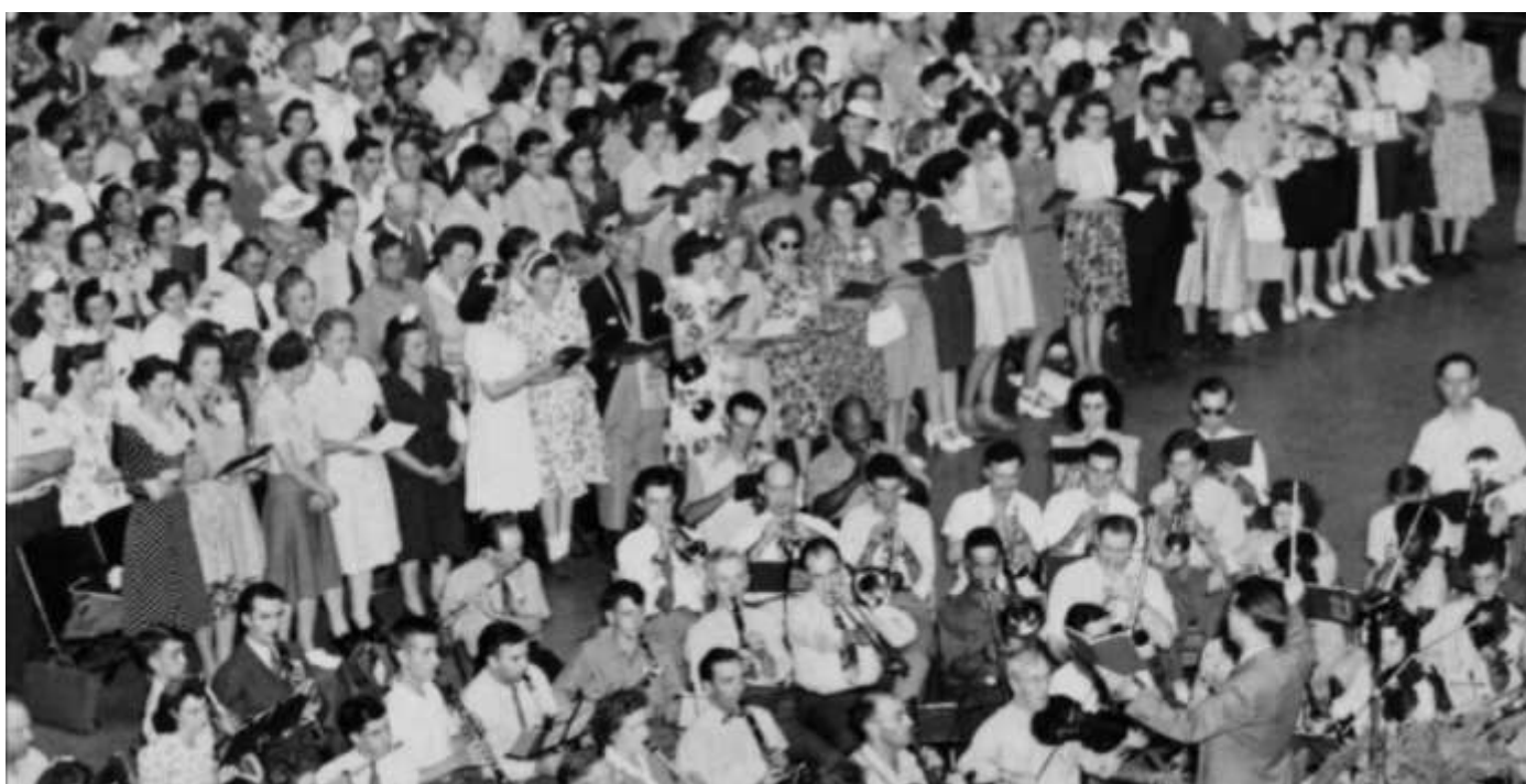
Совместное песнопение на конвенции в Буффало, 1946 год