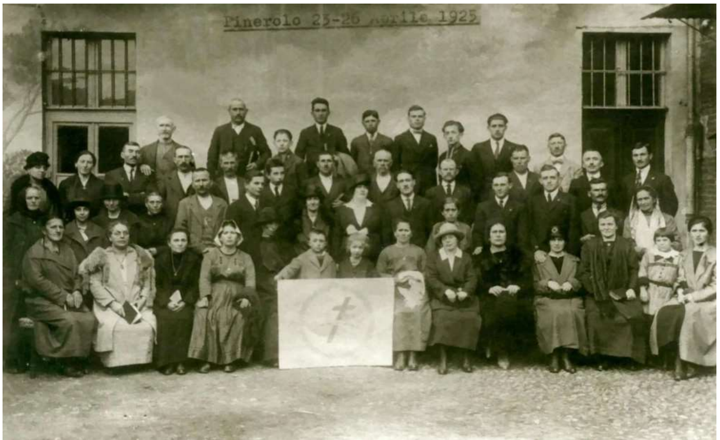
Конвенция Исследователей Библии в Италии, 1925г.