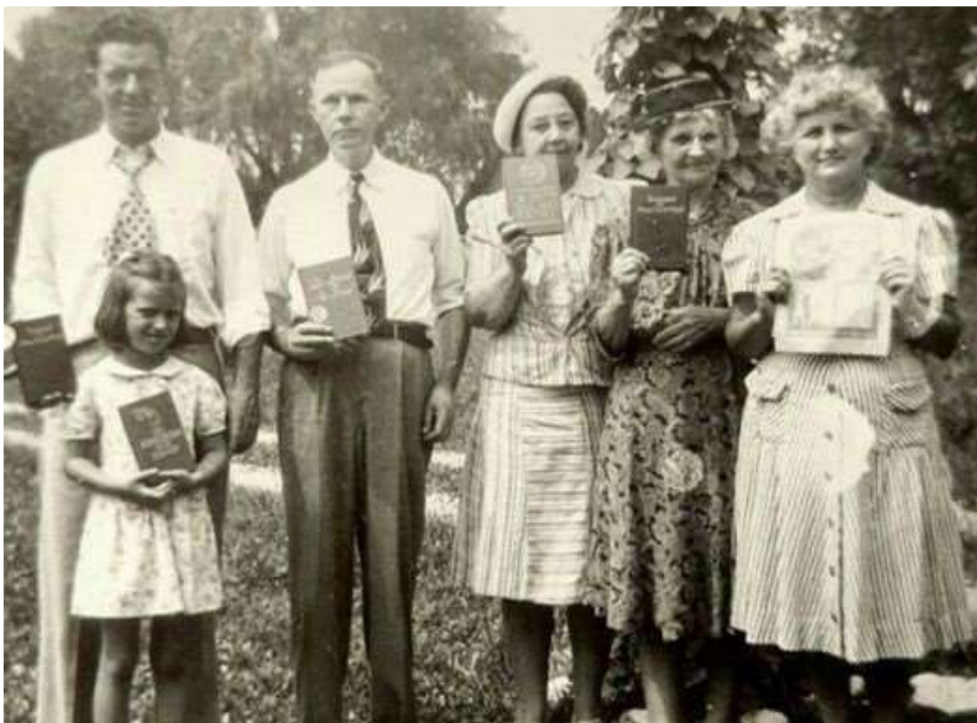
Проповедь с книгами и журналами, 1940-ые годы