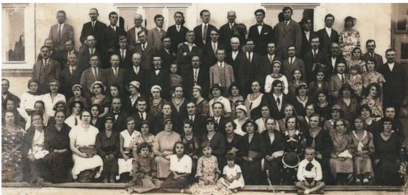
Конвенция в Бориславе 1932г.

Подведем итоги. Согласно теократическому учению, основанному на Священном Писании, начиная с 1926 года и вплоть до 1950 года можем определить следующие случаи, когда посвященным представительницам женского пола, независимо от семейного положения, (замужняя или нет) есть необходимость покрывать голову: