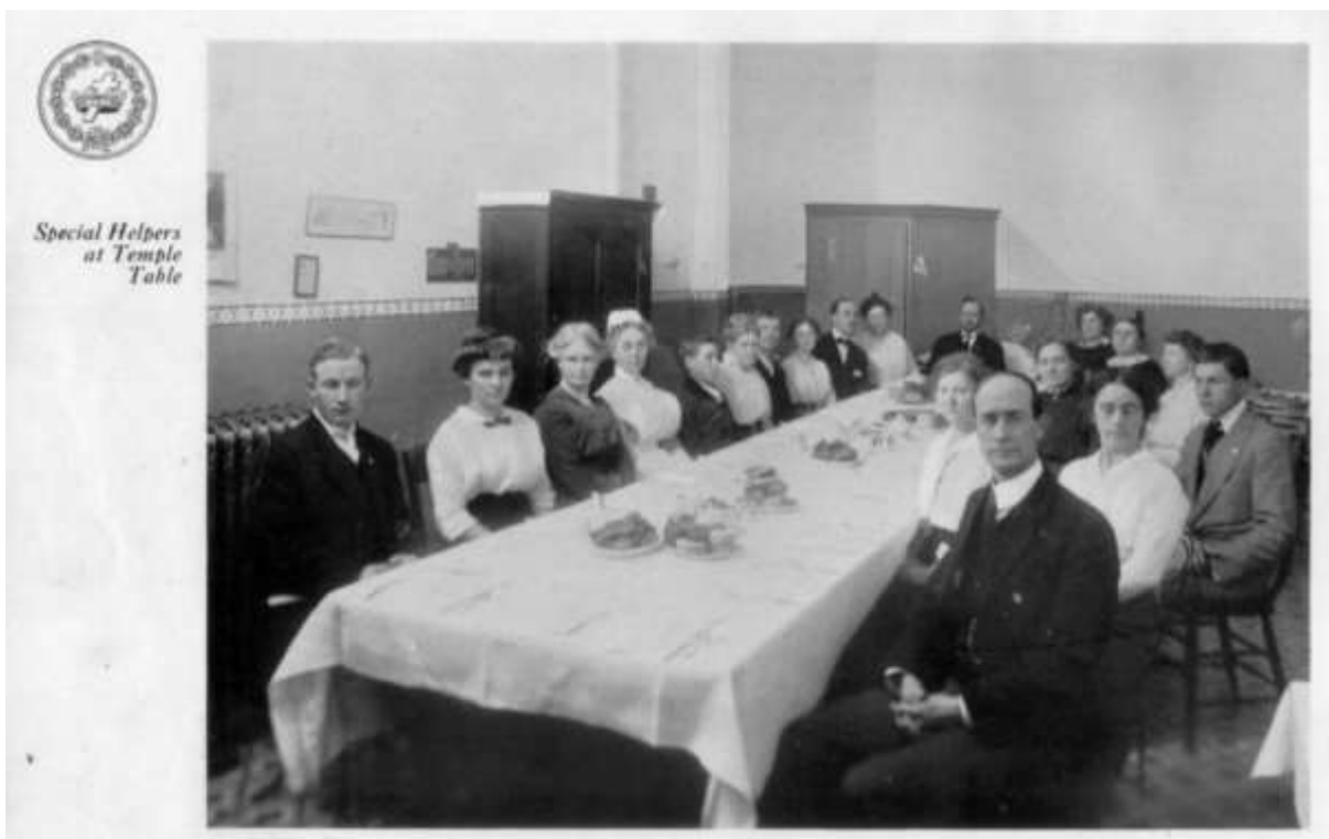
Особые помощники за храмовым столом, США, 1914г.