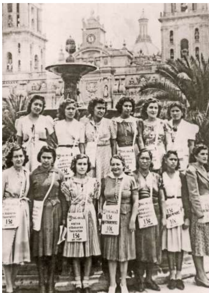
Проповедь с журналами в Мексике, 1945г.