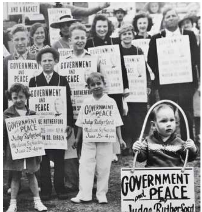
Проповедь с транспарантами, 1930-ые годы