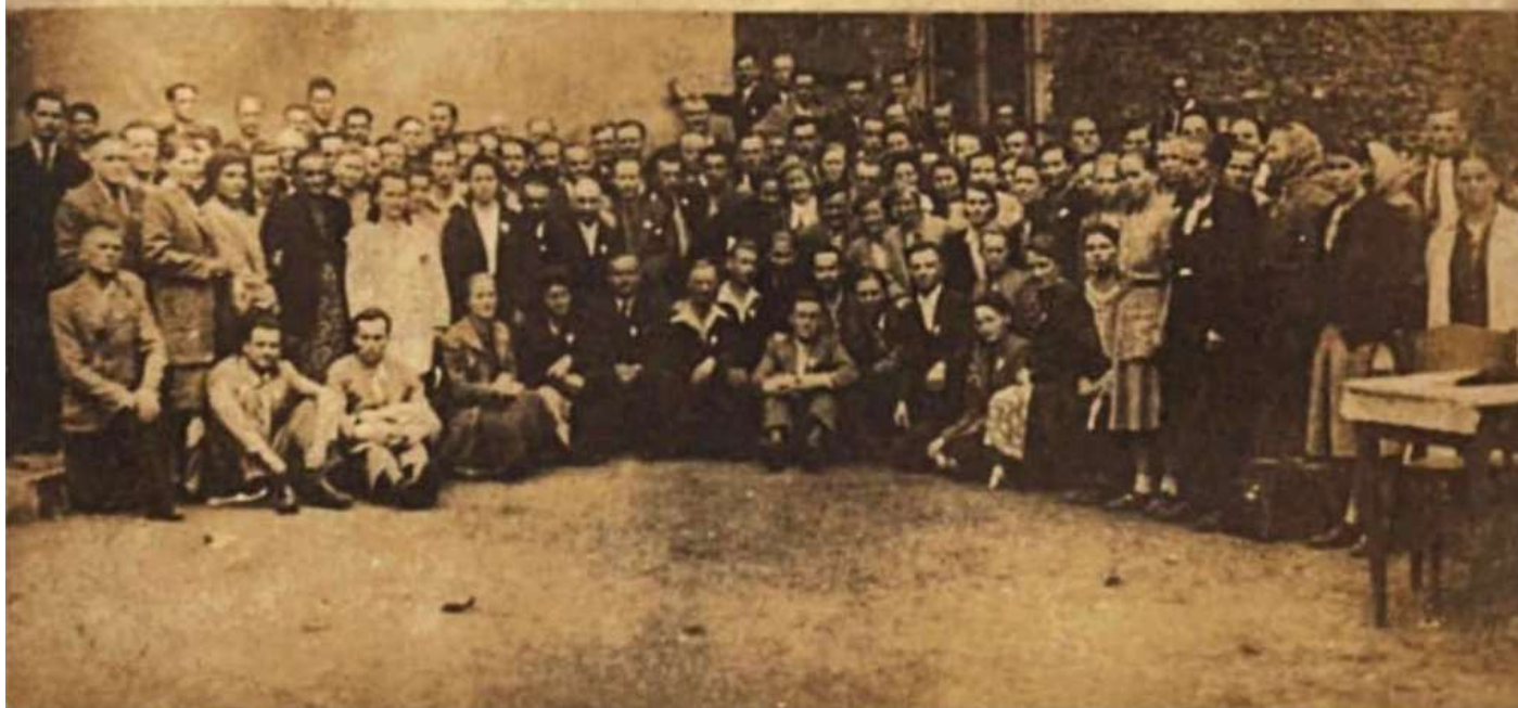
Конвенция в Польше, 1947г.

"Świadkowie Jehowy", którzy przeżyli niemieckie Obozy Koncentracyjne. Fot. na Konwencji w Krakowie 25 i 26.5.1947 r.