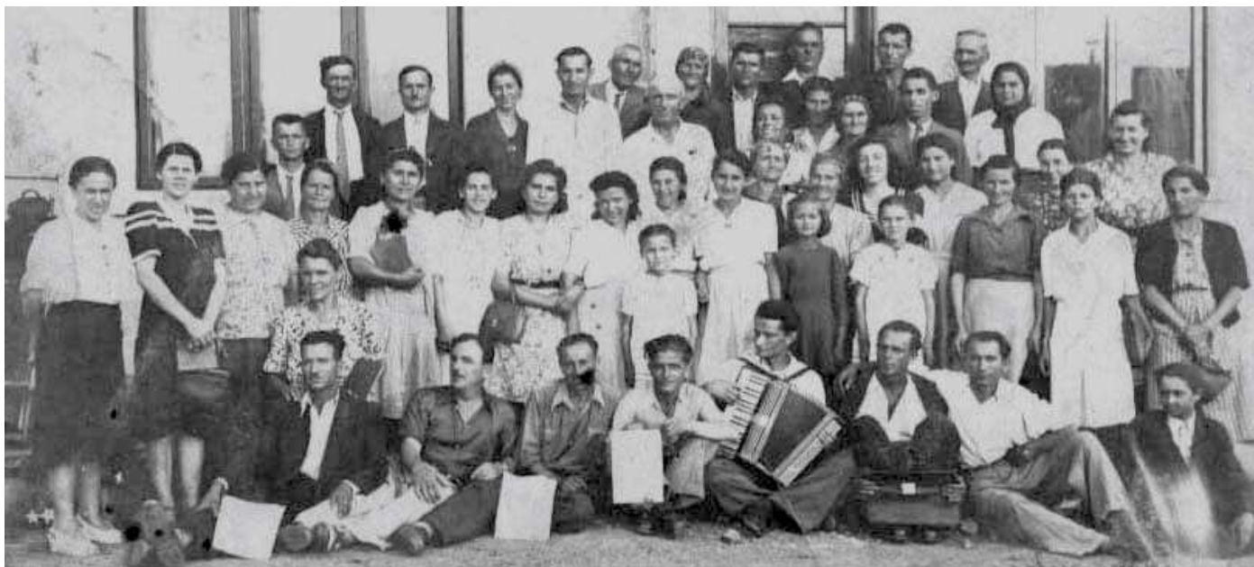
Собрание в Бухаресте, Румыния 1947г.