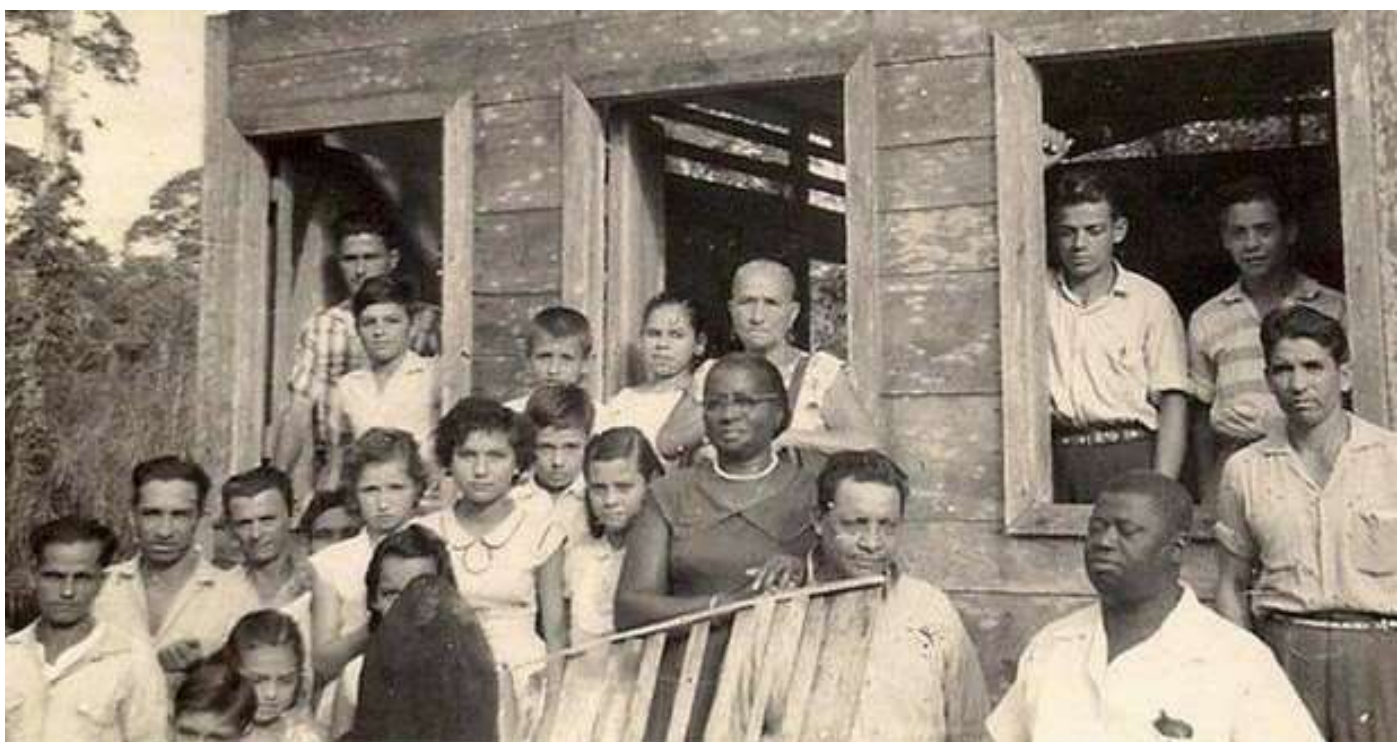
Собрание в Коста-Рике, 1940г.