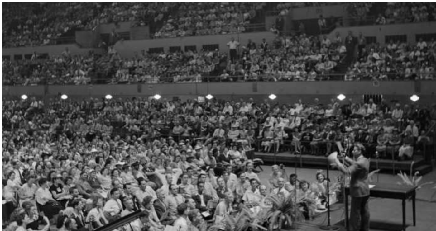
Конвенция в Буффало, 1944г.