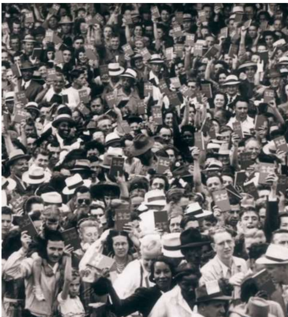
Конвенция в Кливленд Огайо 1946г. (Участники съезда получили книгу «Пусть Бог будет истинным»)