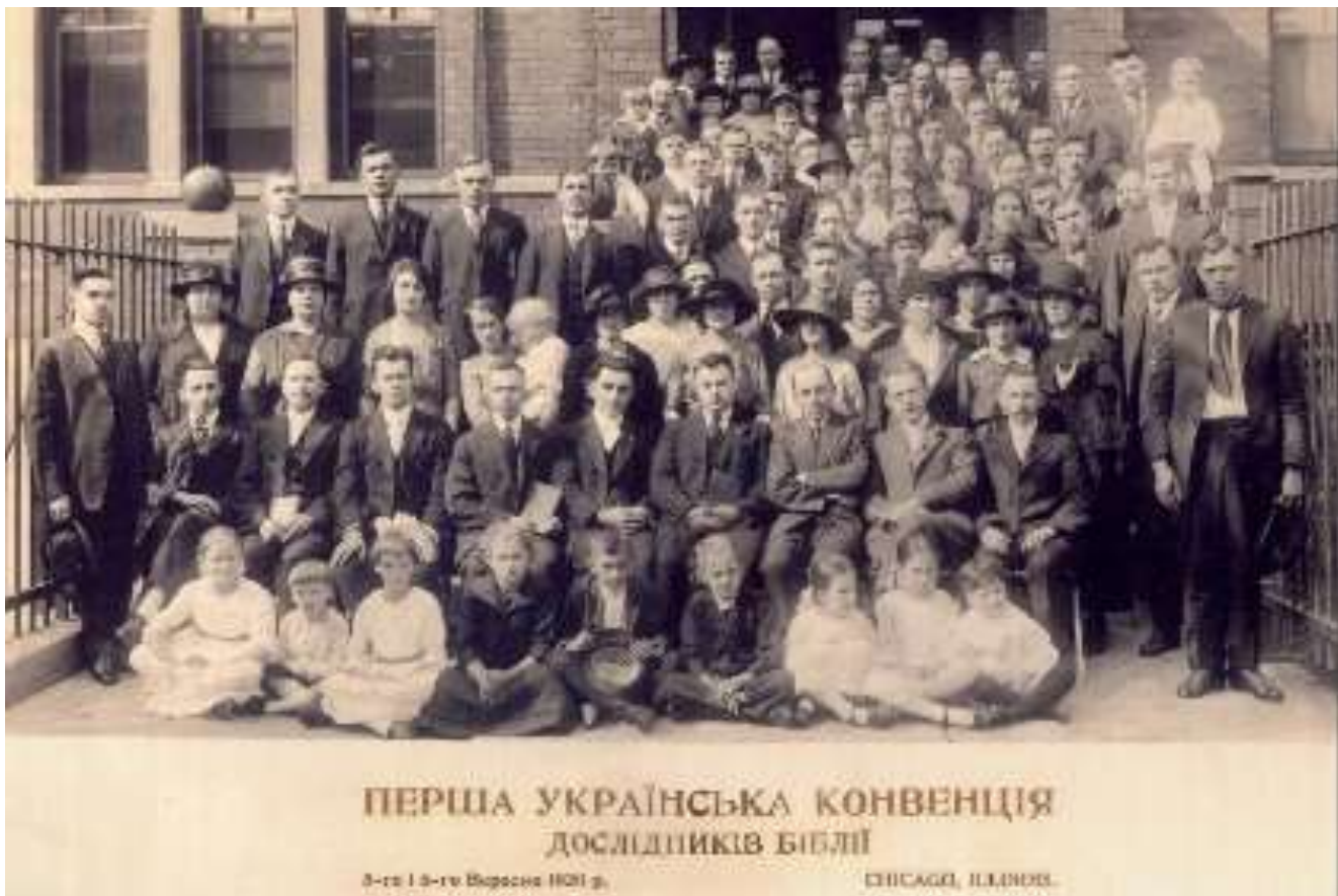
Первая украинская конвенция Исследователей Библии в Канаде, 1920г.