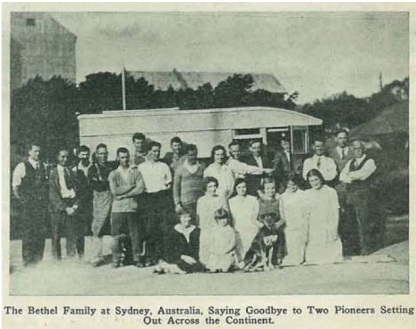
Семья Вефиль из Австралии 1939г.