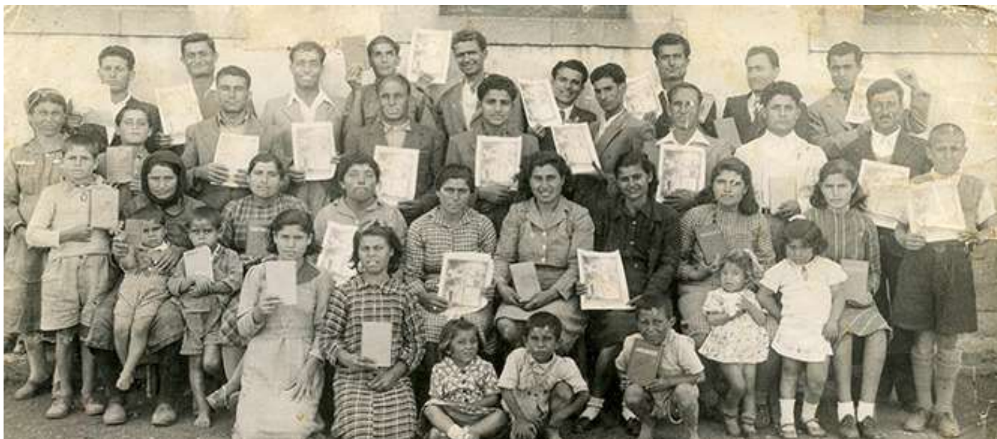
Собрание на Кипре, 1940г.