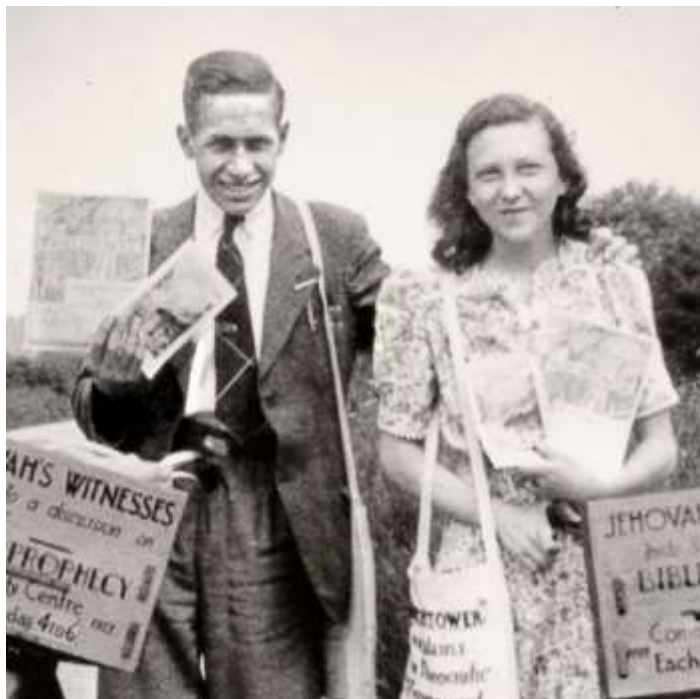
Пионеры в Великобритании, 1940-ые годы